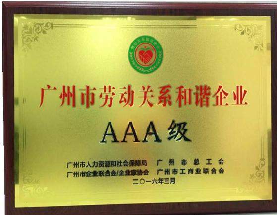
图表 12 劳动关系和谐企业 AAA 级

备有限公司被评为 AAA 级劳动关系和谐企业，广州广日物流有限公司、广州塞维拉电梯轨道系统有限公司被评为 AA 级劳动关系和谐企业。