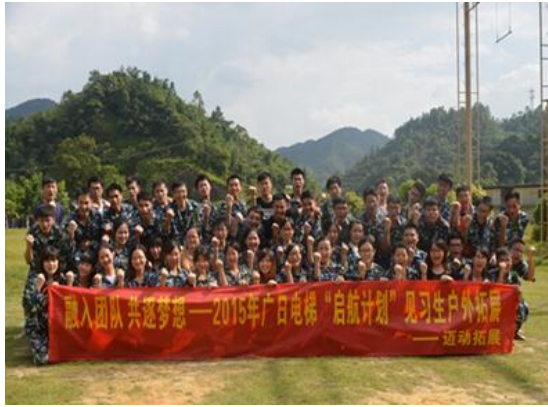
图表 1 员工户外拓展活动