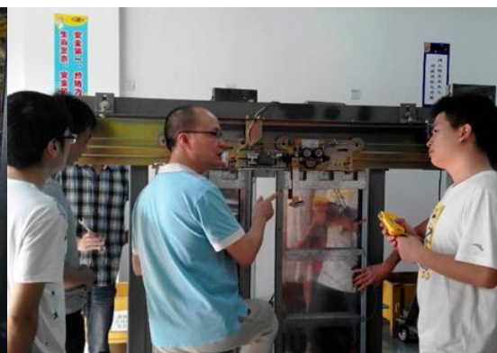
图表 6 专业技能实操演练