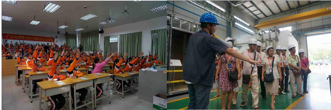
图表 23 电梯安全知识进校园

9月11日，广日电梯在其广州质量教育社会实践基地接待了50多人市民参观团，向市民展示了电梯文化，传播了电梯相关知识。