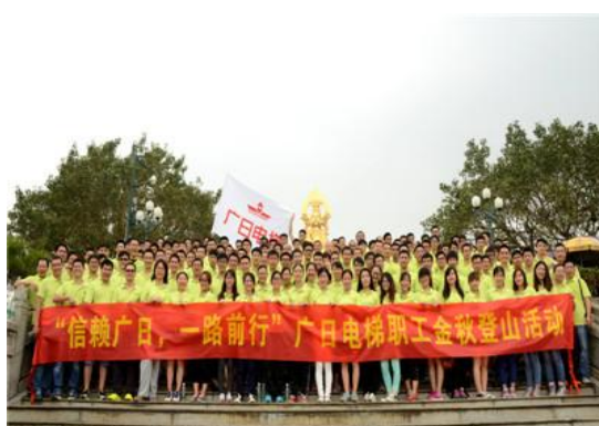
图表 8 职工文体活动（一）

公司非常重视与员工的沟通和交流，不定期召开员工座谈会，通过各种形式进行员工满意度调查，听取员工意见及建议，公司还积极开展有益于提升职工素质、陶冶职工情操的活动。丰富了员工业余文体生活，促进企业和员工关系的和谐稳定。