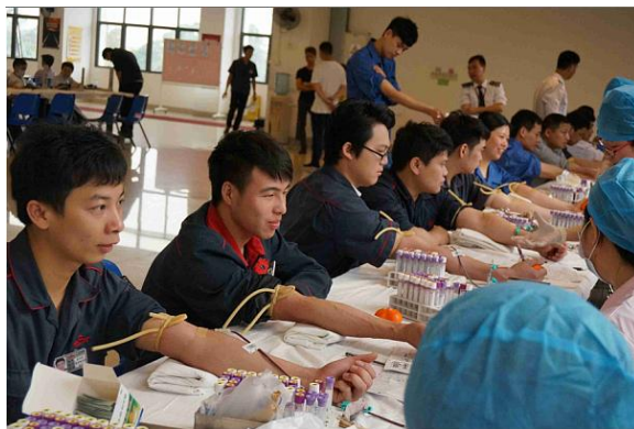
图表 31 参加义务献血活动

其他公益活动还有广日股份、广日电梯、广日电气、广日物流、塞维拉、广日物业 2015 年合共 223 人次参加了番禺区大石镇、石楼镇的无偿献血活动，广日电气志愿者 8 月 15 日协助组织“公益·家—社区公益市集”活动以及广日物业 8 月协助石楼镇食安办组织“食品安全进厂区”的宣传