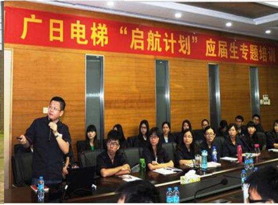
图表 2 新员工专题培训