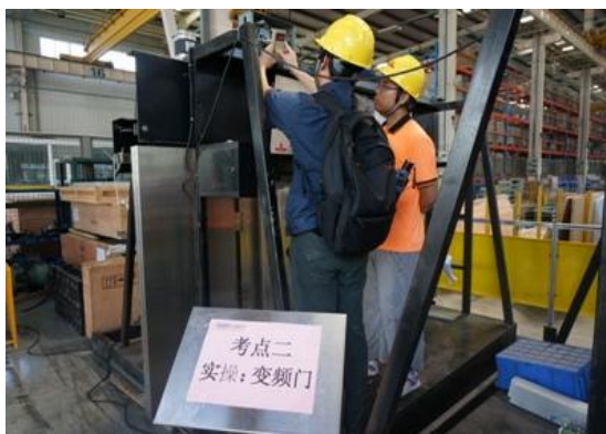
图表 5 员工技能评定考试

公司积极推进员工职业发展体系的建立工作，在公司下属企业逐步建立起管理类、专业技术类、技能类晋升通道，通过建立技能评定体系和配套的晋升政策，鼓励员工注重个人能力的提升，拓宽了职业发展通道和发展空间，实现员工与公司的共同成长。