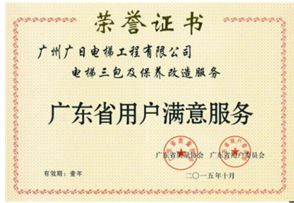
图表 18 广东省用户满意服务奖项

广日物流本着“以客户为中心”的理念，持续改进，提升客户对我司的满意度，不断提升公司的整体形象。2015年综合数据统计显示，处理客户反馈率达到100%，客户对我司总体服务评价达满意程度。