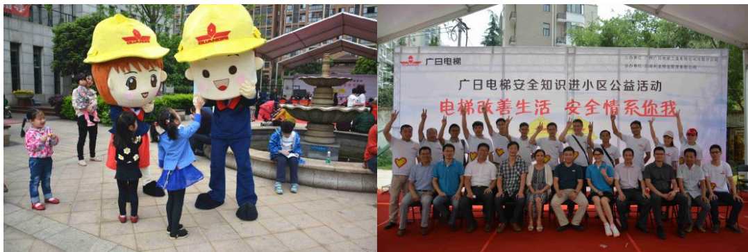
图表 25 电梯安全知识宣传进小区（一）