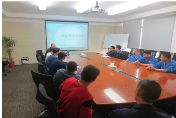
图表 14 供应商沟通会议

广日电梯在 2015 年，实行供应商签订《广日电梯供应商 CSR 行为准则承诺书》覆盖率达到 95%以上，并积极开展 CSR 行为的评估与验证。同时，同时公司也会定期召集部分供应商参与公司月度质量会议和月度供应商会议，及时分析供应商交货和质量异常情况，持续改进供应商交货及产品质量管理，以实现互利共赢、共同成长的目标。