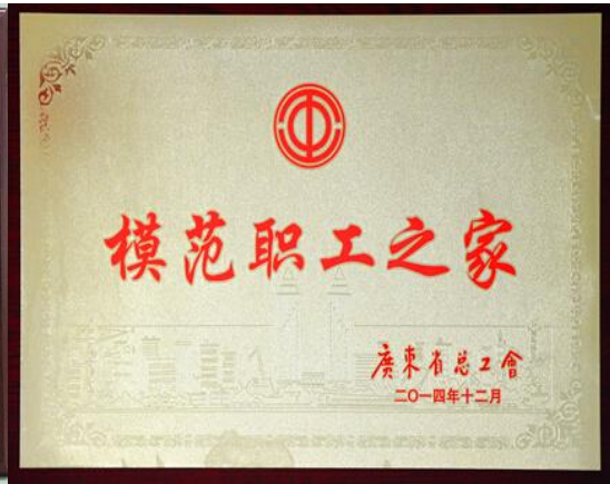
图表 13 广东省模范职工之家