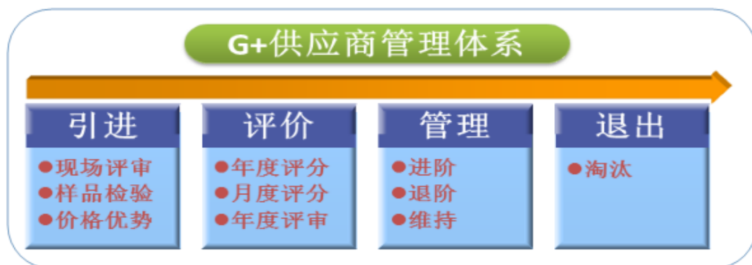
图表 15 G+ 供应商管理体系

广日电梯于 2014 年建立富有广日特色的 G+ 供应商管理体系,进一步完善公司的供应商管理流程及日常考核办法,使得供方管理工作有据可依、有章可循。该体系的建立,提升我司供方管理的灵活度,针对不同类型的供方给出不同的评审方案,提出不同的要求;完善我司供方管理体系,搭建供应链管理的框架,为后期供方管理工作指明方向。同时倡导阳光采购,在引进供应商、供应商确认、评审、资料提交均在公司监察部门监察下开展,起到有效监督的作用。