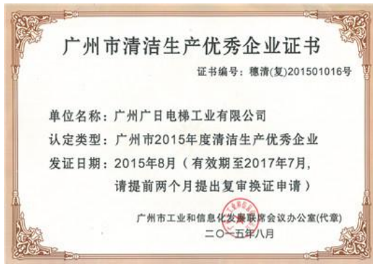
图表 22 广州市 2015 年度清洁生产优秀企业

广州塞维拉秉承绿色生产理念，从原材料采购、设计、生产过程全部符合国家环保要求。部分喷涂板件上，公司采用环保水性漆，含 VOC 量极低，减少对环境的污染。