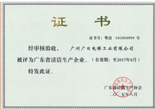
图表 23 广东省清洁生产企业