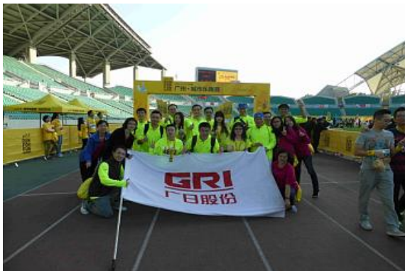
图表 29 参加城市乐跑活动

在支持体育事业上，广日股份 11 月 27 日组织本部及下属各企业共 197 人参加由万科主办，联合城市有影响力的企事业单位参与的广州城市乐跑赛，含捐款在内合共投入 27,935.6 元；广日电气 11 月 30 日组织公司志愿者参加“益动广东公益活动”筹划捐款 10,800 元。