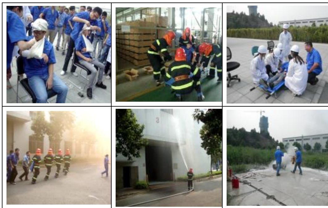
图表 20 消防应急综合演练活动

各企业创建各项示范单位和评选先进单位。其中广日电梯积极开展“平安企业”创建工作，成为“广州市创建平安企业活动达标单位”，被广州市特种设备行业协会创建领导小组授予“平安企业”荣誉称号。广日电梯经广州市安全生产监督管理局审核通过，被评为“广州市企业安全生产先进集体”。广日股份及广日电梯分别获得由中共委员会及石楼镇人民政府颁发的“番禺区石楼镇二〇一五年度安全生产先进单位”称号。