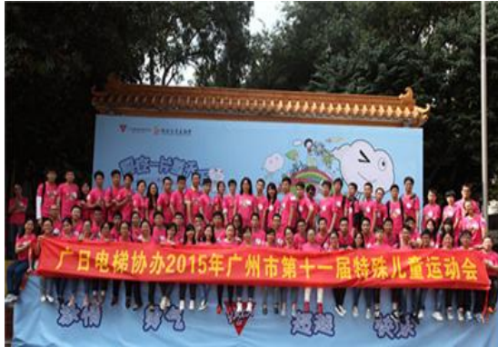
图表 27 协办广州市第十一届特殊儿童运动会