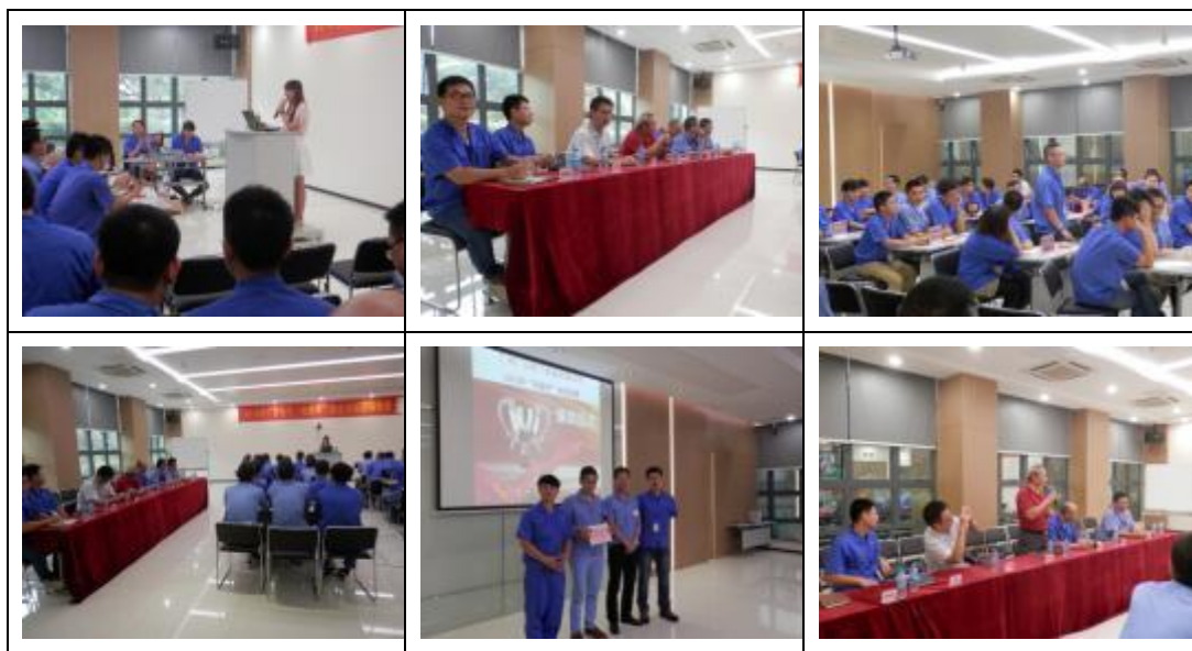
图表 21 “安康杯”职业安全健康竞赛

赛获优秀奖；广日电梯 9 月 22 日协助 CCTV10 完成《原来如此》电梯维保及安全使用节目拍摄并于 11 月播出，9 月 23 日协助《广东安全生产》杂志社完成《广用安全 日就月将》班组安全生产摄影并于 10 月号上半月刊登；日立电梯 12 月 7 日邀请广州市安全生产协会俞述西会长对网络工厂安全生产责任人进行新《安全生产法》教育。其他企业也在“安全生产月”举办不同题材的安全生产知识竞赛或劳动技能竞赛，全面体现了安全文化企业建设的景象。