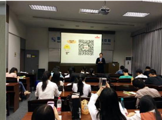
图表 4 员工内部培训

公司积极推进员工职业发展体系的建立工作，在公司下属企业逐步建立起管理类、专业技术类、技能类晋升通道，通过建立技能评定体系和配套的晋升政策，鼓励员工注重个人能力的提升，拓宽了职业发展通道和发展空间，实现员工与公司的共同成长。