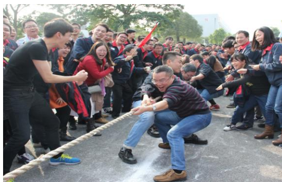
图表 10 职工文体活动（三）