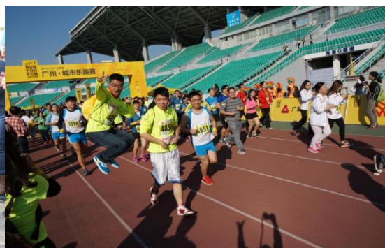
图表 11 职工文体活动（四）

在创建劳动关系和谐的企业工作中，本公司下属的广州广日电梯工业有限公司被评为 AAA 级劳动关系和谐企业、广东省“模范职工之家”，广州广日电气设