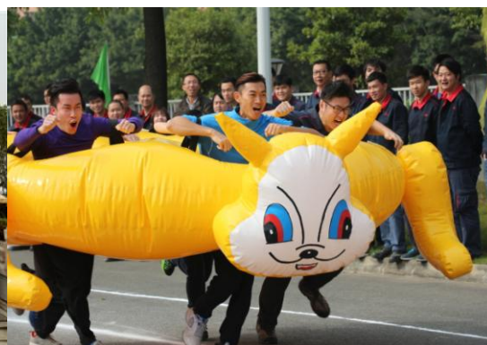
图表 9 职工文体活动（二）