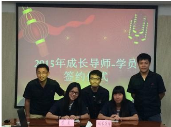
图表 3 导师-学员双选