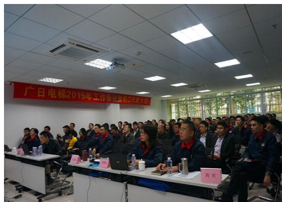
图表 7 职工代表大会

充分发挥工会在员工权益保障方面的作用，对涉及员工切身利益的方案和规章制度，均通过工会组织审议后再施行。推进厂务公开，通过职工代表大会等形式对公司发展计划等重要事项进行审议，保障职工参与企业发展管理的权利。