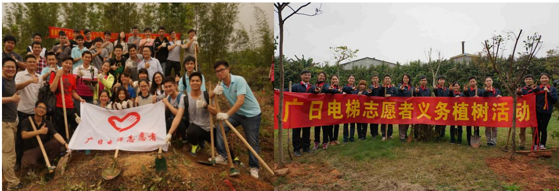
图表 30 举办志愿者义务植树活动

共 140 多人参加以“青春阳光广日人，绿色环保中国梦”为主题的团员、志愿者活动，植树近百棵。遵循公司的可持续发展理念，积极履行了社会责任，扎实开展公益环保活动，促进了经济、社会和环境的协调发展。