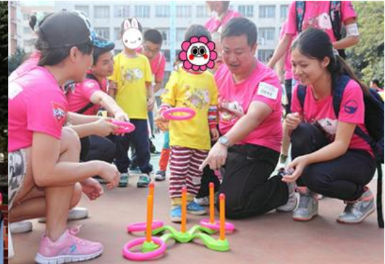
图表 28 与特殊儿童交流

在支持体育事业上，广日股份 11 月 27 日组织本部及下属各企业共 197 人参加由万科主办，联合城市有影响力的企事业单位参与的广州城市乐跑赛，含捐款在内合共投入 27,935.6 元；广日电气 11 月 30 日组织公司志愿者参加“益动广东公益活动”筹划捐款 10,800 元。