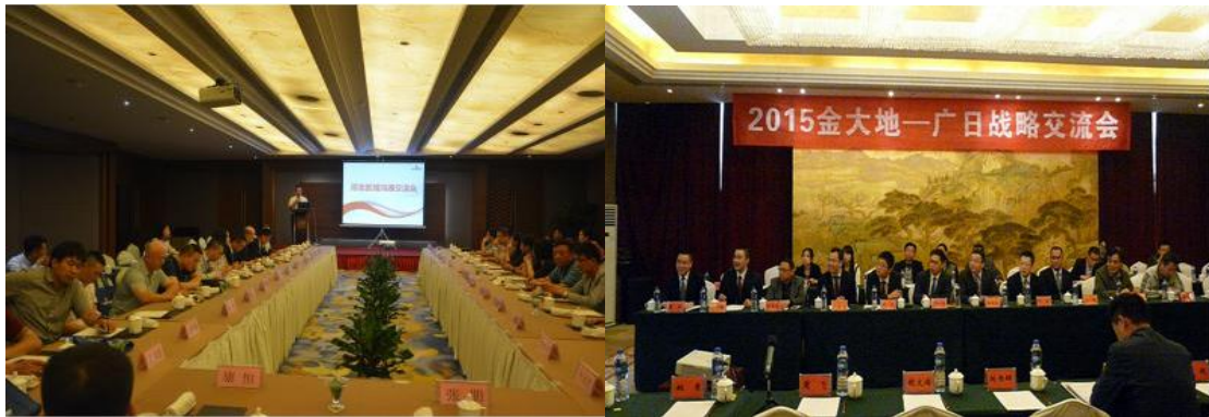
图表 17 战略客户交流

其中建业、朗诗、奥园、金大地、当代、大汉等众多知名企业已成为广日电梯长期的战略合作伙伴，彰显了广日电梯品牌在消费群体中的地位。